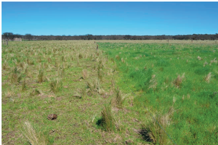
Figura 1. Vista general del área dónde fueron colectados los ejemplares de Ranunculus platensis Spreng.

Habitat: Los ejemplares de R. platensis fueron colectados en un potrero agrícola-ganadero con revegetación espontánea ubicado en el sector norte del establecimiento agropecuario (36° 26'