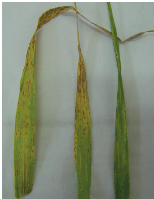
Foto 1. Hojas de cebada con síntomas del salpicado necrótico.