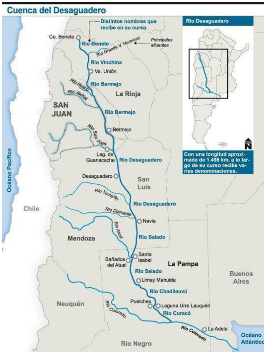
Fotografía 1: Cuenca Hidrológica del Desaguadero y del Atuel-Salado-Chadileuvú-Curacó en la provincia de La Pampa.

La bibliografía (Diferi, 1980; Cazenave, 1995; UNLPam, 2012) da cuenta del contraste entre una época y otra, ya que mientras la decisión de promover el desarrollo en base al riego utilizando la subcuenca del Atuel consolida para mediados del siglo XX -en Mendoza- “un oasis al sur del territorio que actualmente comprende 100.000 hectáreas empadronadas con derecho a riego y una red de 2.530 km. de longitud” 4 , en la provincia de La Pampa el impacto negativo se mide en los aspectos socio productivo, económico, demográfico, ambiental y cultural.