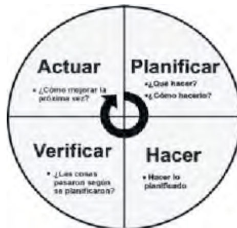
Figura 1: Circulo PDCA

4-. ACTUAR, que significa implantar acciones que aseguren la consecución de los objetivos del proceso y su mejora continua.