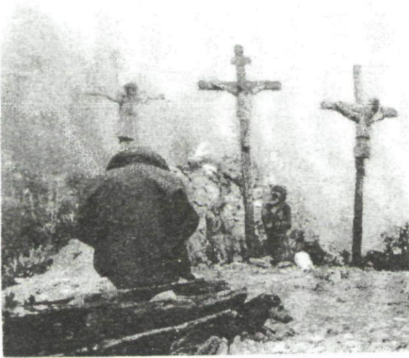
El calvario está integrado por diez piezas fundamentales. A él se llega por dos escaleras

Más arriba de la capilla grande y cercado a ambos lados por escalones una estructura de piedra de múltiples texturas y volúmenes se crea un pesebre del pueblo de Belén. Más arriba y sobre una terraza se alza la plaza Bolívar construida en 1967, para ser coronado con el conjunto escultórico, conformado por 10 figuras talladas en madera que recrean la crucifixión de Jesucristo. Un santo sepulcro en roca y la resurrección completan el conjunto.