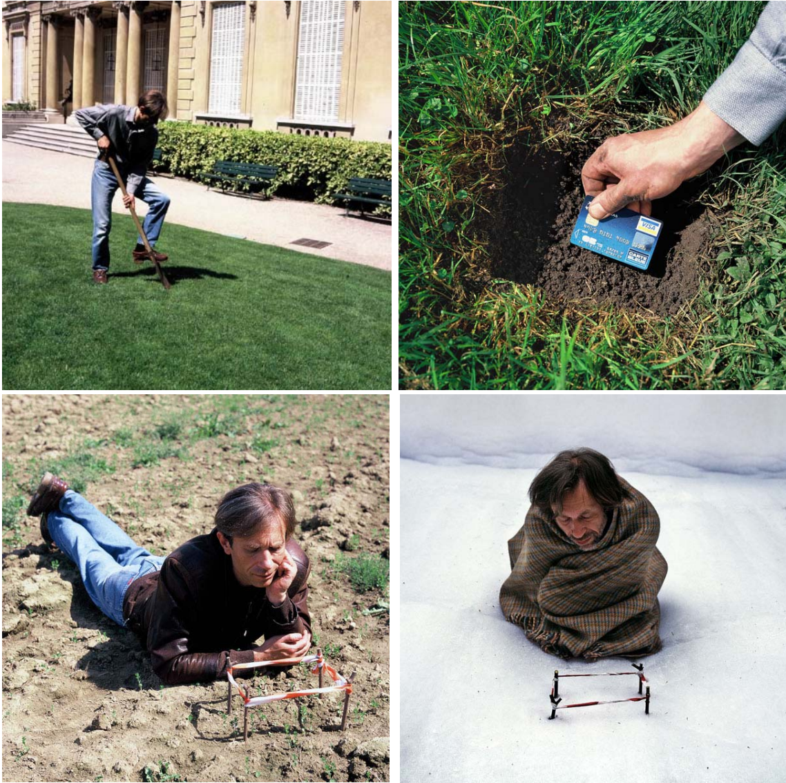
Imagen 5. D. Tsykalov: Plantation à la carte

las familias se parchean con endeudamiento de forma algo arriesgada. También el afán consumista explica parte de la dependencia del uso de la tarjeta de crédito. La política económica podría reducir esta dependencia impulsando mejoras salariales para los trabajadores y/o mejores transferencias sociales para los necesitados.