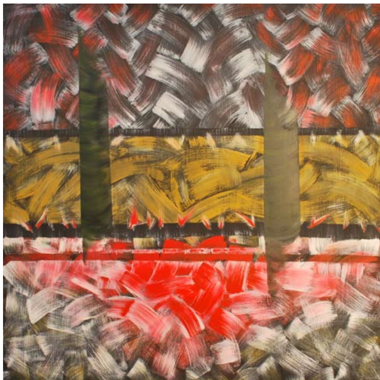
"Todo lo que quedó", óleo. Gustavo Gaggero

la teoría no queda ni del lado de afuera, ni puede ser vista como dicotomizada, menos aún entendida como posterior o anterior a la práctica. Hace falta reconocer que en las investigaciones en y con los cotidianos no se puede escapar de la unidad ' práctica-teoría ', tal como de su crítica permanente (Alves, 2010: 15).