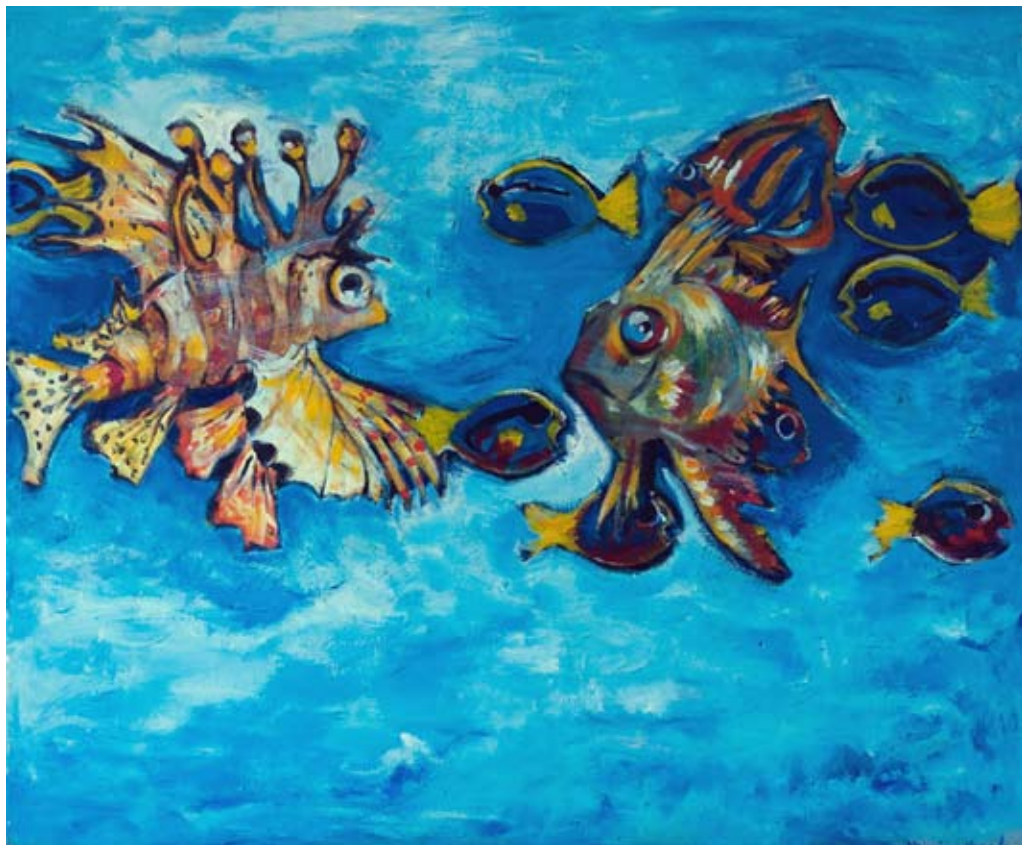
"Peces", acrílico. Nora Urquiza

Fecha de Aceptación: 14 de abril de 2014