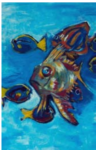
Detalle "Peces", acrílico. Nora Urquiza