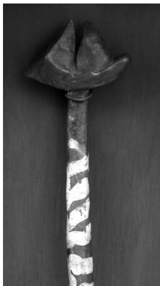
Detalle "Ave viajera", técnica mixta (madera, metal, cerámica, pintura acrílica). Noemí Fiscella