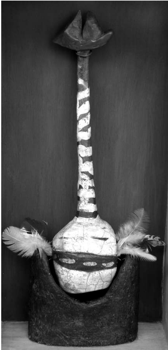
"Ave viajera", técnica mixta (madera, metal, cerámica, pintura acrílica). Noemí Fiscella

participaban en la investigación. Pero ¿cómo retenerles, cómo generar un vínculo que les sirviera para profundizar en su autoconocimiento o que simplemente les aporte ese momento de reflexividad productiva que le ayude a dar luz y sentido a algún pasaje oscuro o no dicho de su experiencia escolar? Le hemos dado muchas vueltas a lo que suponíamos tenían que hacer como trabajo derivado de la relación narrativa. También nos preocupaba mantener su interés, pues la participación en la investigación se me manifestaba como clave para sacar algo valioso de sus textos, dibujos y de sus palabras.