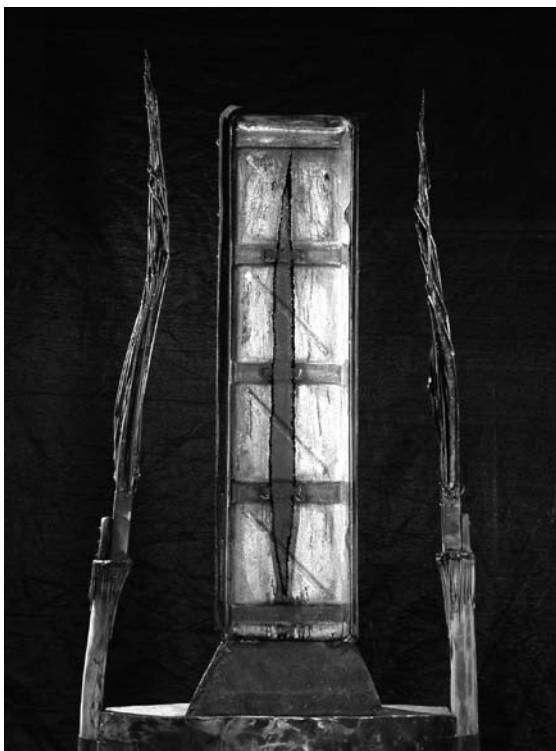
“La ceremonia del viento” , hierro reciclado y soldado. Ruben Schaap

La carrera se proyecta como una profesión liberal que garantiza cierto respaldo laboral y económico. Se presentan con claridad las alternativas que se pueden barajar al momento de recibirse y no anticipan otras o nuevas posibilidades de realización laboral.