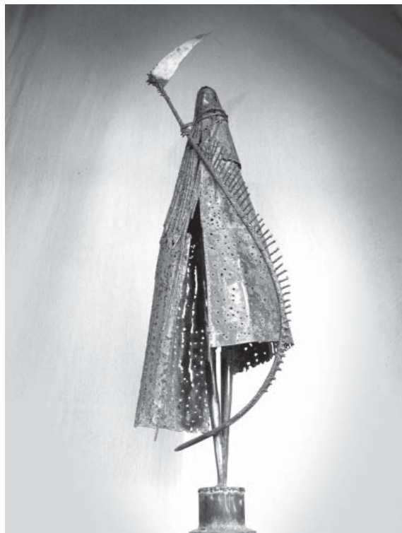
“Parca”, hierro reciclado y soldado Rubén Schaap

ternativas pueden y están siendo creadas incluso en una época de enorme presión sobre los docentes para que simplemente se concentren en estándares establecidos y resultados de evaluaciones.