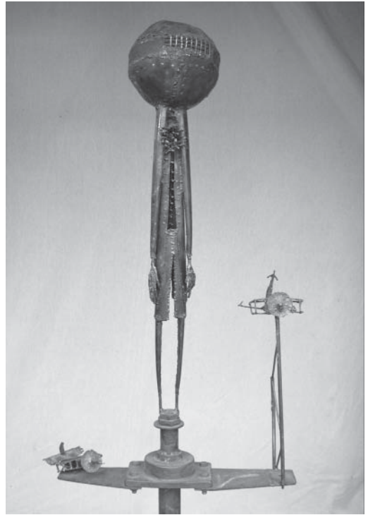
“Inocencia armada”, hierro reciclado y soldado Rubén Schaap

Las cuestiones que he mencionado no son, por supuesto, completamente nuevas. Los educadores críticos y trabajadores culturales, incluyendo a Paulo Freire (Freire, 1972), han mencionado cuestiones similares en muchos países y durante muchos años. Podemos aprender una cantidad