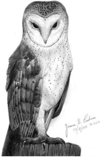
“Tyto Alba”, dibujo a lápiz Jimena Contreras

bación de leyes generales sobre ambiente (que establecen la creación de estructuras estatales y facilitan el desarrollo de políticas e instrumentos para la implementación de la EA). La autora recalca que, por sí solas, las leyes no dan cuenta de una política efectiva de EA. En la mayoría de los países de América Latina, la gestión de la EA es responsabilidad de los Ministerios de Ambiente, y no de Educación. Por último, destaca que casi la totalidad de las leyes sobre ambiente obligan a la incorporación de la dimensión ambiental en los Sistemas Educativos Nacionales, sin embargo sólo Argentina, Ecuador y Perú refieren a la EA en sus leyes educativas.