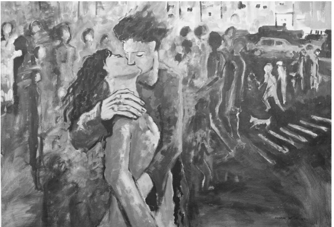
"El beso", óleo Ricardo Arcuri