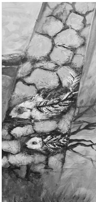
Detalle obra "Postales de hoy", Ricardo Arcuri