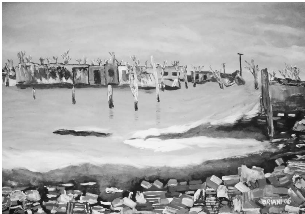
“Restos de Epecuén”, óleo Carlos Oriani

Para el docente apasionado, la “conectividad” con los alumnos es una prioridad para alentar la motivación y el entusiasmo (Day, 2006: 42). Esta conectividad forma parte de la enseñanza, porque: “La palabra es enseñanza” (Levinas, 2002: 129). La enseñanza no transmite un contenido abstracto, no consiste en asumir una función, la palabra instauro la comunidad, en una tematiza-