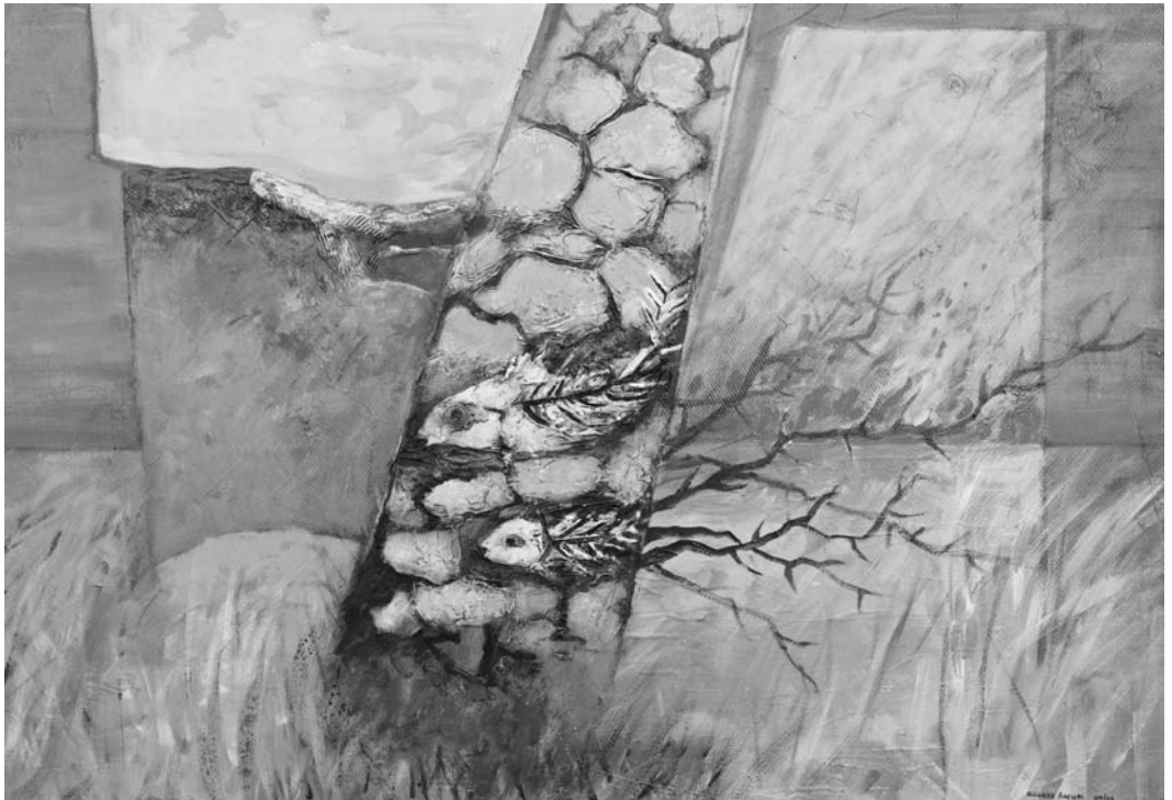
"Postales de hoy", acrílico Ricardo Arcuri

Fecha de aceptación: 18 de julio de 2012