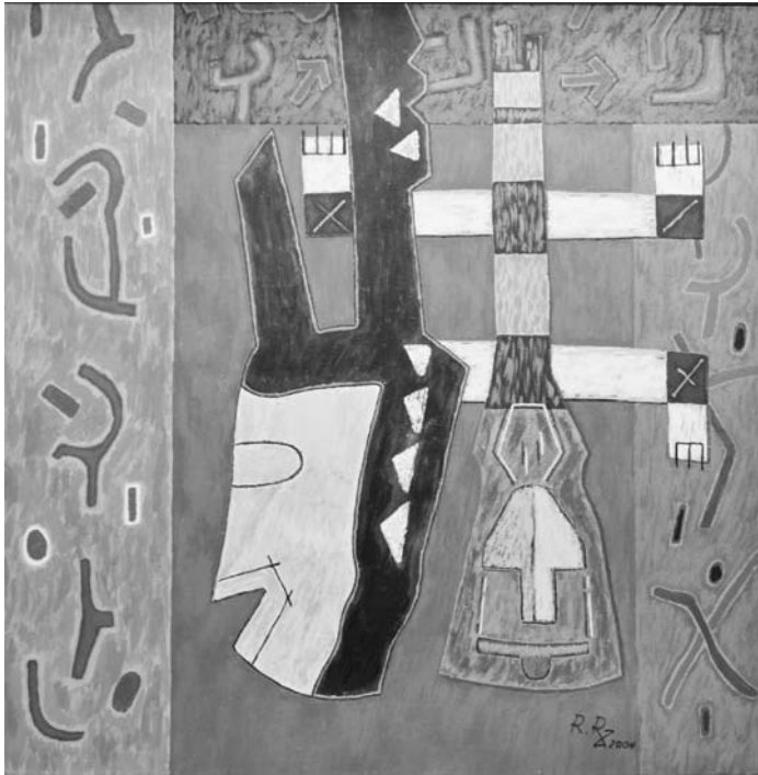
“Yatenga-Kanaga (Burkina Fasso-Mali)”, acrílico sobre tela, Rodolfo Rodríguez

presente y a las concepciones personales” (Porta, 2011: 267).