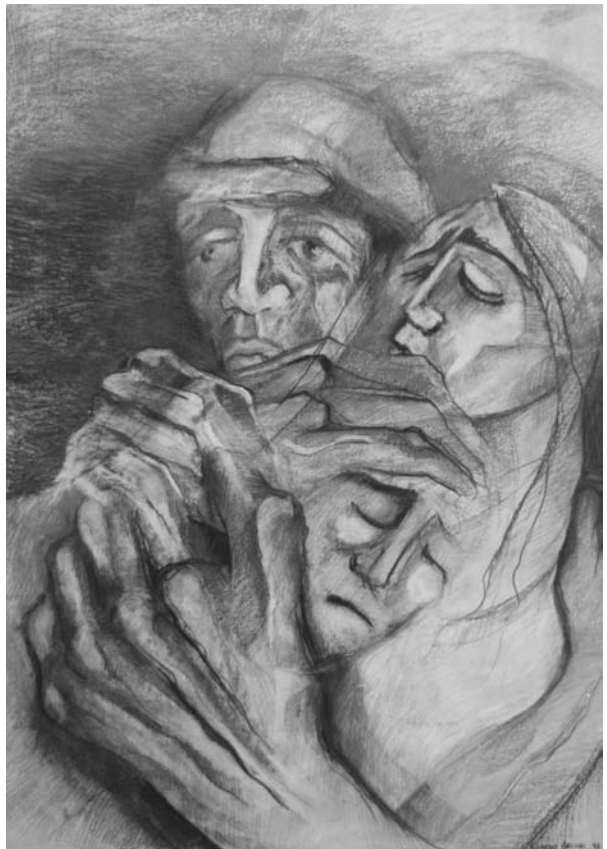
“Protección I”, dibujo, sanguina Ricardo Arcuri

“He luchado durante quince años por elevar el nivel moral y material de los que sufren, y, en nombre de mi partido, obtuve leyes que dignifican el trabajo y gravan el privilegio; que velan por la mujer obrera, para quien yo he deseado ardientemente la igualdad ante la fuerza y la belleza, con respecto a las mujeres de las otras clases; leyes que suprimen la tortura de los niños en las fábricas y que amparan a los pequeñuelos sin madre, huérfanos de todo afecto, que todavía no han caído, y cuyo único delito es el de no haber conocido nunca la dulzura de una caricia materna” (Ibid.:38-9).