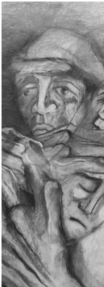
Detalle obra "Protección I", Ricardo Arcuri