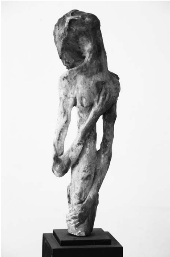
“Espera dramática”, cerámica Ricardo Arcuri

En 1934 el paralelo entre la situación social de los humildes y la condición nacional de las islas era casi directo. Al reivindicar islas sin utilidad aparente para la Argentina, denostaba a un legislador británico que en 1848 las había llamado “Islas Miserables”