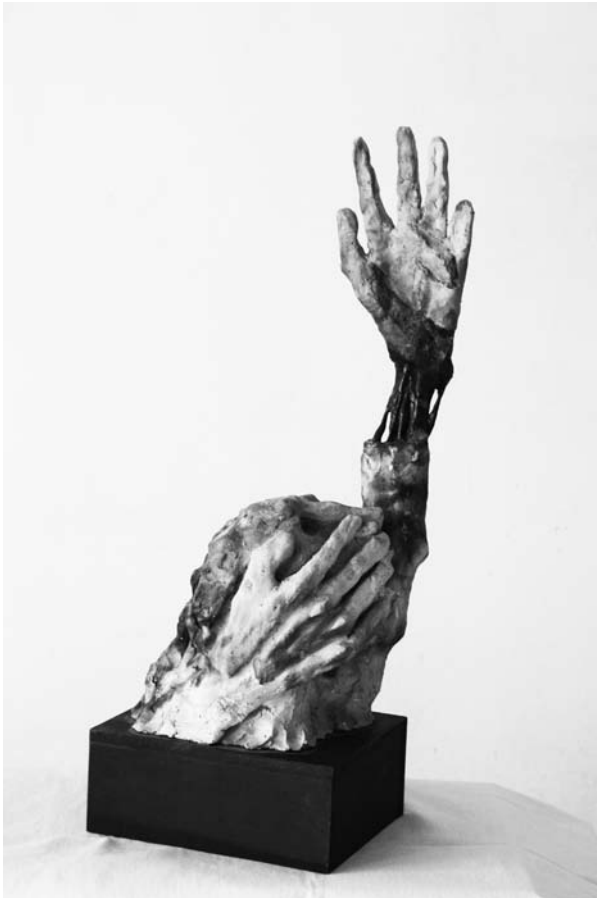
“Las venas abiertas de...”, cerámica Ricardo Arcuri

Podemos empezar la unidad con una radio, encendiéndola en un sector de aula,