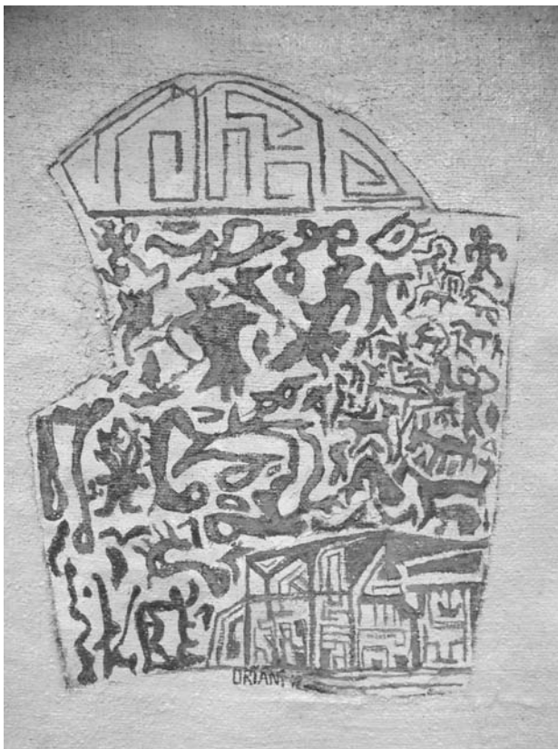
“La ruca del Taconao”, óleo, Carlos Oriani

tudiantes por el contenido varía de modo sutil e importante), la conexión con los límites de la experiencia y los extremos de la realidad (ahora los estudiantes se ven fascinados con los aspectos exóticos y extremos de la realidad, tal como lo documenta el Libro de Records Mundiales Guinness ), las asociaciones con lo heroico (esta herramienta les da confianza a los estudiantes y les permite adoptar, en cierto grado, las cualidades de los héroes con los que ellos se ven asociados), el ver al conocimiento en términos de cualidades humanas (esta herramienta enfatiza el hecho de que todo conocimiento es conocimiento humano y el producto de la esperanza, el temor y las pasiones de alguien, y de ese modo hace que el mundo se abra hacia una alfabetización más significativa), el coleccionar algo o desarrollar un hobby (la necesidad de entender de manera segura algún rasgo de la realidad puede estimular muchas actividades de alfabetización), y un sentido del asombro (el asombro capta la imaginación de los estudiantes tanto en el mundo real como ficticio que la alfabetización les abre). Estas son en su totalidad herramientas que pueden usarse para