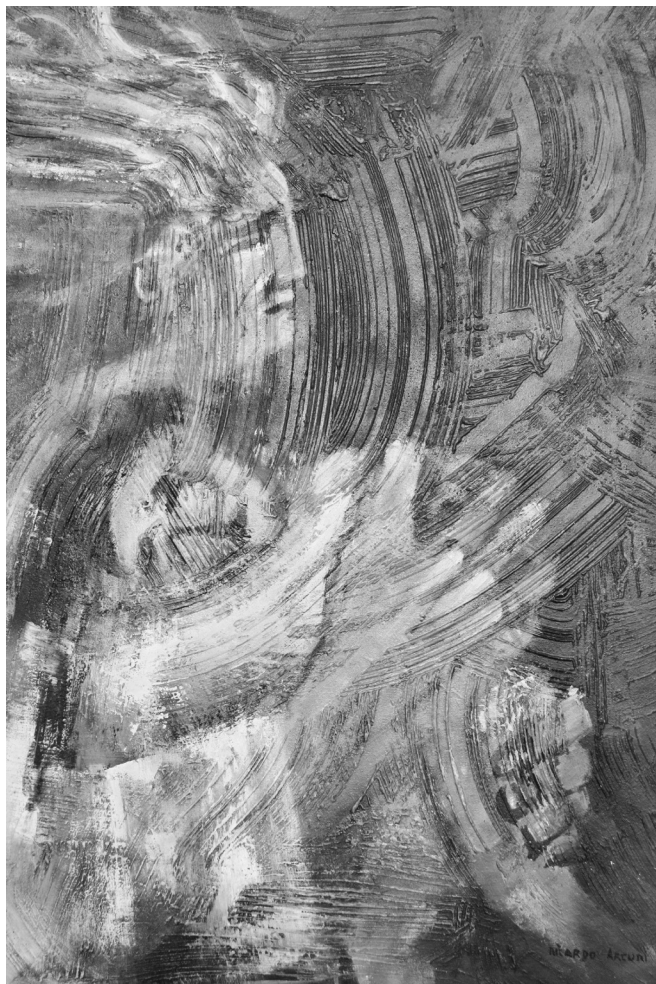
“Protección II”, técnica mixta Ricardo Arcuri

A partir de entonces los alumnos estarán listos para trabajar sobre algunas historias, y también para inventar historias para “do”/