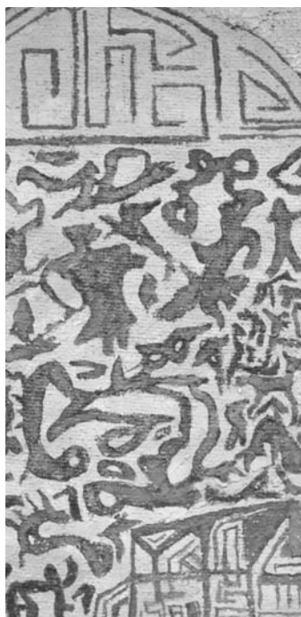
Detalle obra "La ruca del Tac-nao", Carlos Oriani