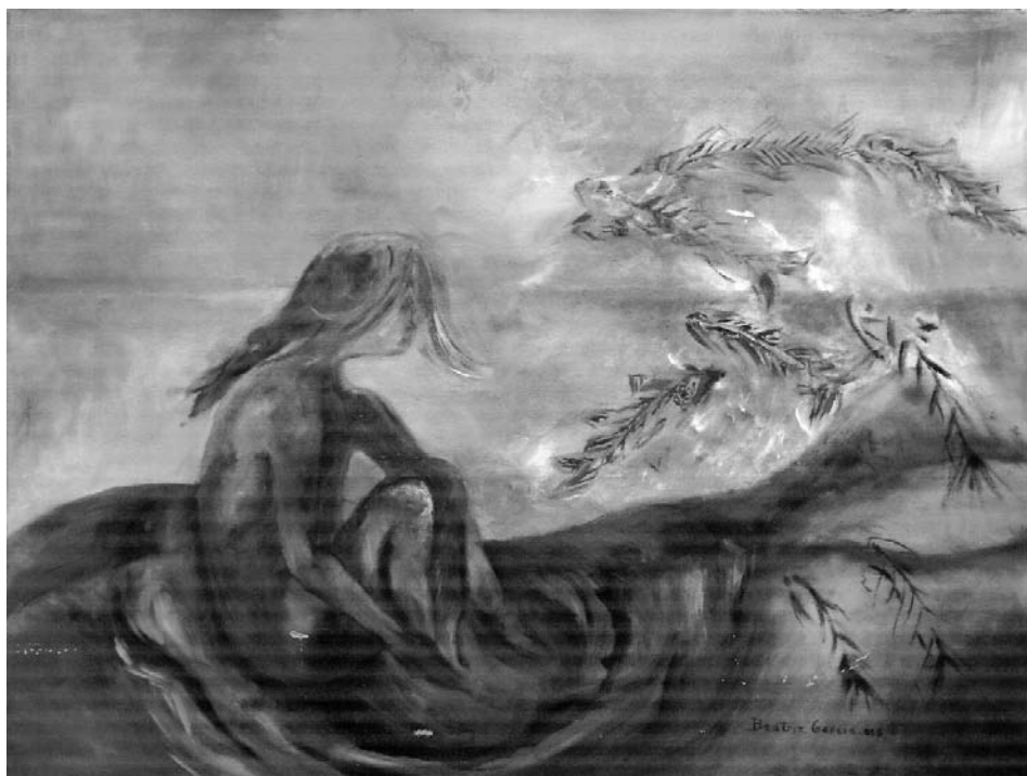
“Alguna vez fue (Cuadro azul)”, óleo Beatriz García