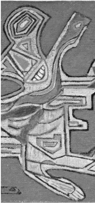
Detalle obra "Habiendo llover", Carlos Oriani