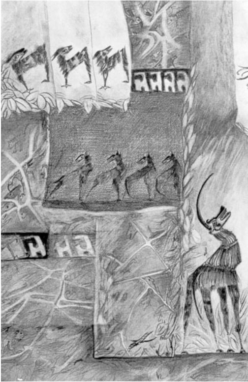
“Llamado”, tinta y lápiz Rosario Fernández