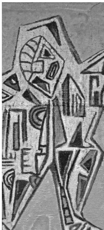
Detalle obra "Figura", Carlos Oriani