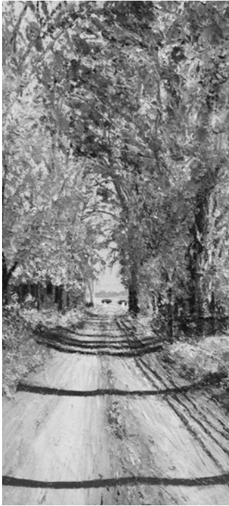
Detalle obra "Entrada al campo", Néstor Salamero