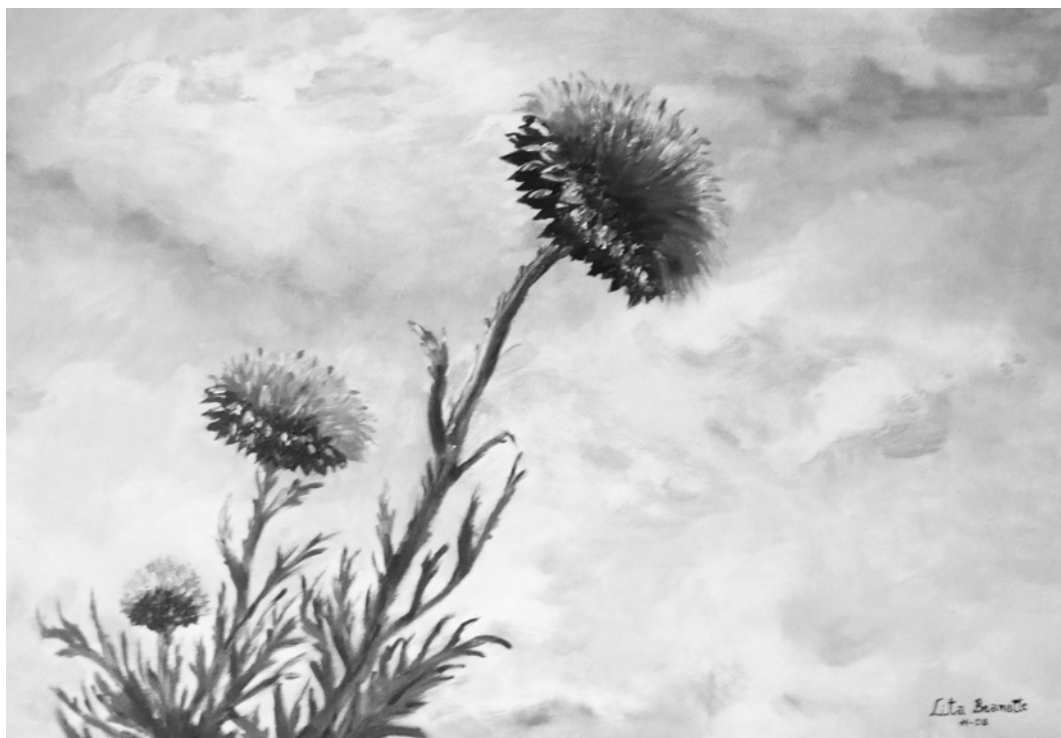
“Pampa y cardos”, óleo Lita Beanatte

Una enorme masa de energía (física, emocional, intelectual, política) se disipa en actividades que se realizan para cumplir con las exigencias que el dispositivo tecno-burocrático de la auditoría instala en diferentes espacios de la vida cotidiana de la Universidad. Llenar planillas, hacer informes, hacer entrar la trayectoria profesional en los estrechos formatos del programa informático, se convierten en rutinas que expropian progresivamente el sentido de enseñar, investigar, gestionar, etc. Energía individual y colectiva que se invierten en realizar acciones –en parte ilusorias y en parte mistificadas– y que en gran medida son destructivas y auto-destructivas, en tanto producen una desvalorización y debilitamiento