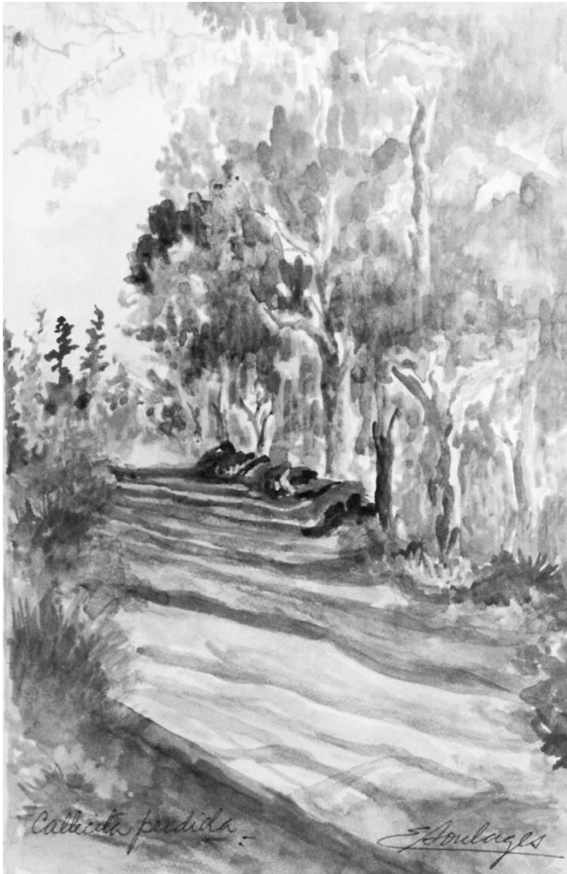
“Callecita perdida”, acuarela Eliana Soulages de Leiva

signan las funciones tradicionalmente asignadas a la Universidad. Este trabajo recupera y expone la noción cultura de la auditoría a fin de analizar las tensiones que genera su implementación en las prácticas universitarias y los efectos disruptivos que ésta produce sobre la cultura organizacional.