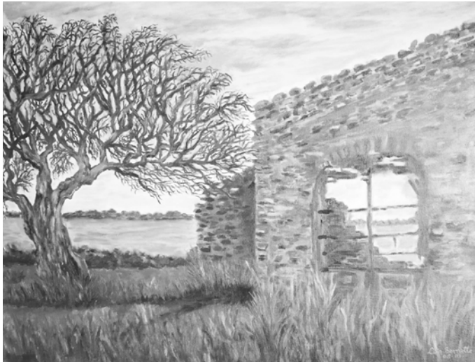
“Tapera”, óleo Lita Beanatte

de la identidad como académicos y, por ende, generan una pérdida de sentido y de posibilidades de agenciamiento profesional.