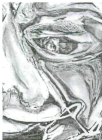
Detalle de Obra «Raíces» Estela Jorge