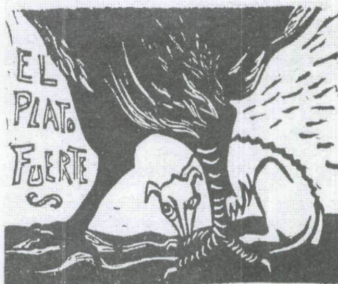
"El plato fuerte" Dini Calderón

Los condicionantes subjetivos hacen referencia a la dimensión ética de la práctica social, al carácter ético de las acciones y decisiones coherentes con los fines educativos. Se establece así una relación entre norma moral y práctica docente, de tal manera que cada acción educativa dentro de un marco institucional determinado permite seleccionar principios prácticos a través de los cuales la moral se plasma en acción, regulando toda la práctica docente. A su vez, ambos autores caracterizan a esta práctica como social, histórica, y contextualizada: "... es una práctica social, contextualizada en un tiempo y en un espacio..."; "...es una práctica histórica, dinámica, incierta, impredecible, compleja..."