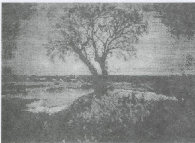
Bajo Giuliani I

Iniciamos el trabajo con algunas precisiones conceptuales que orientaron el desarrollo de la experiencia. A continuación describimos las características y aspectos metodológicos de la