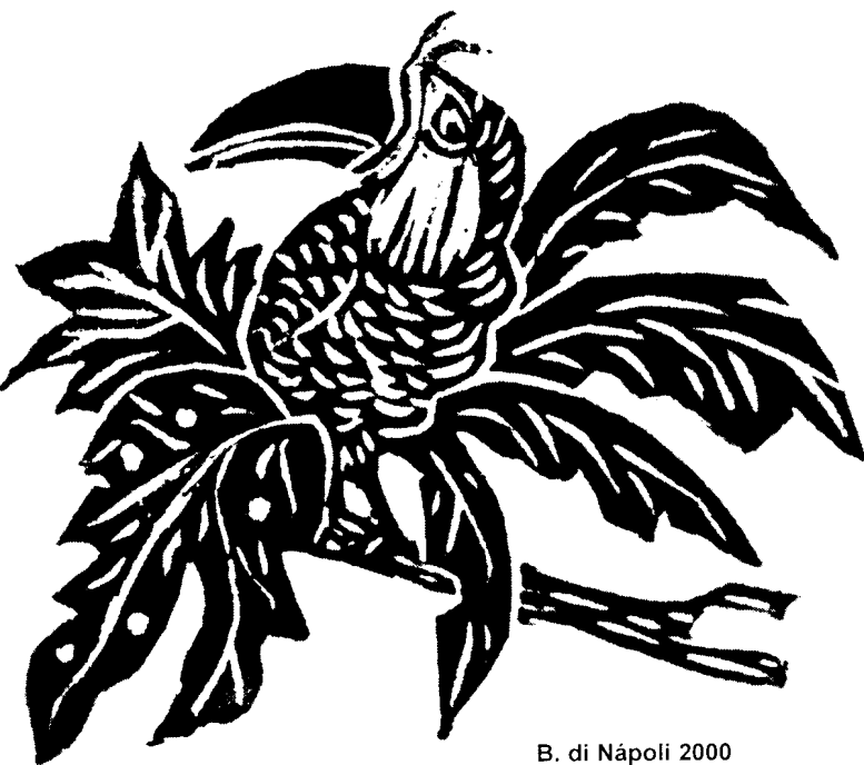
B. di Nápoli 2000

Autonomía: definida como la posibilidad de percibir diferentes demandas sin verse compelido a una respuesta inme-