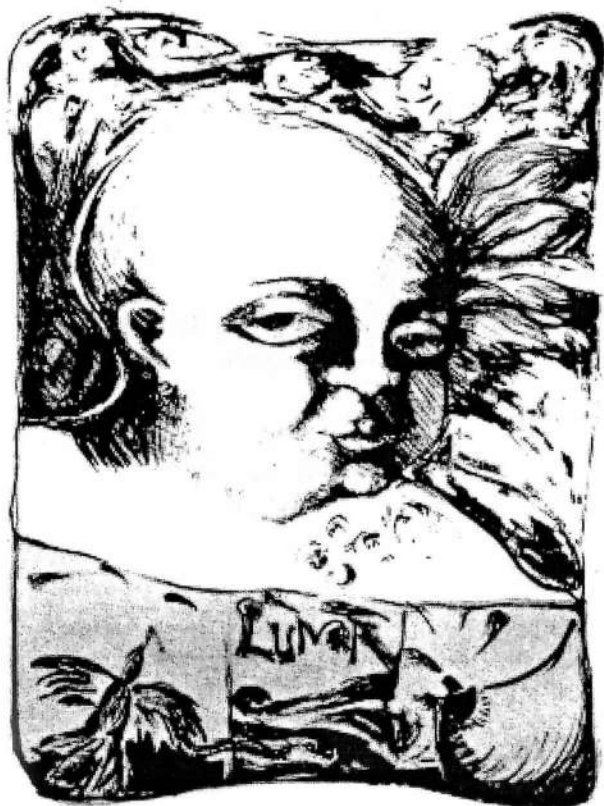
Pensando en el futuro Dini Calderon