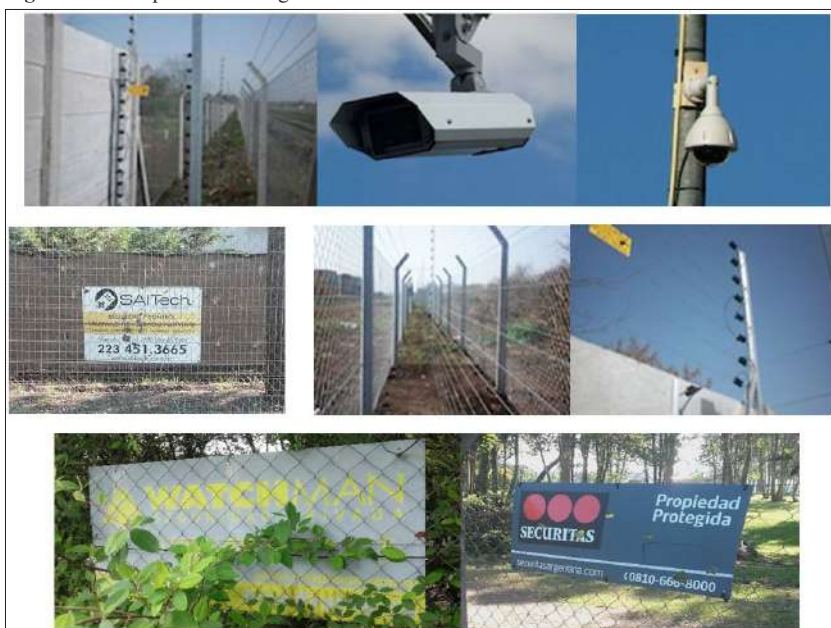
Figura N° 4. Dispositivos de seguridad