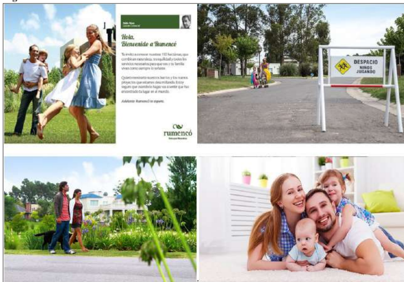
Figura N° 2. Publicidades de barrios cerrados