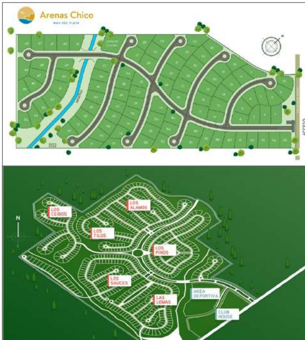
Figura N° 3. Plano de los loteados en Rumencó y Arenas Chico