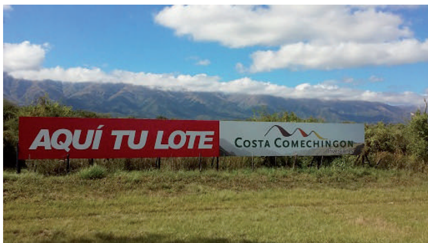
Figura 2. Cartelería sobre la Ruta Provincial N° 1