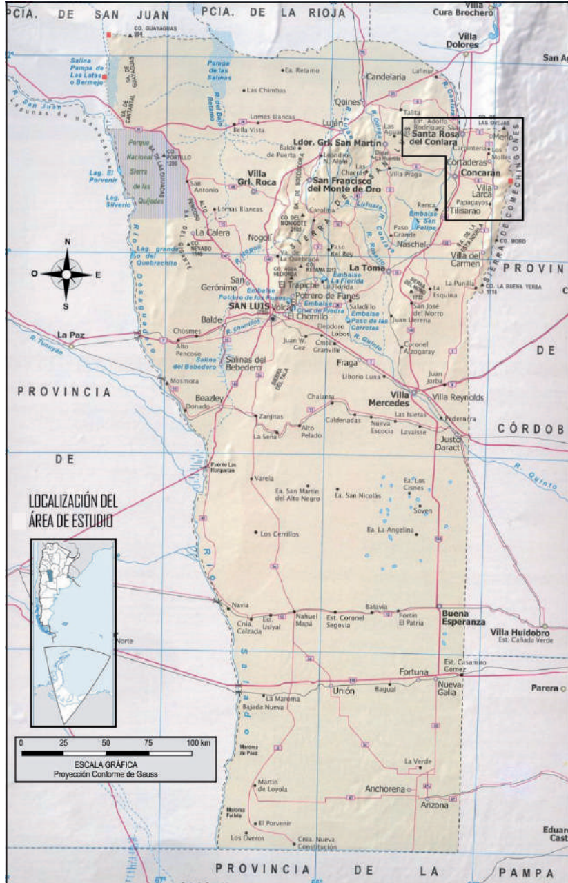
Figura 1. Localización del área de estudio marcada en rojo

Elaboración propia a partir de cartografía vial.