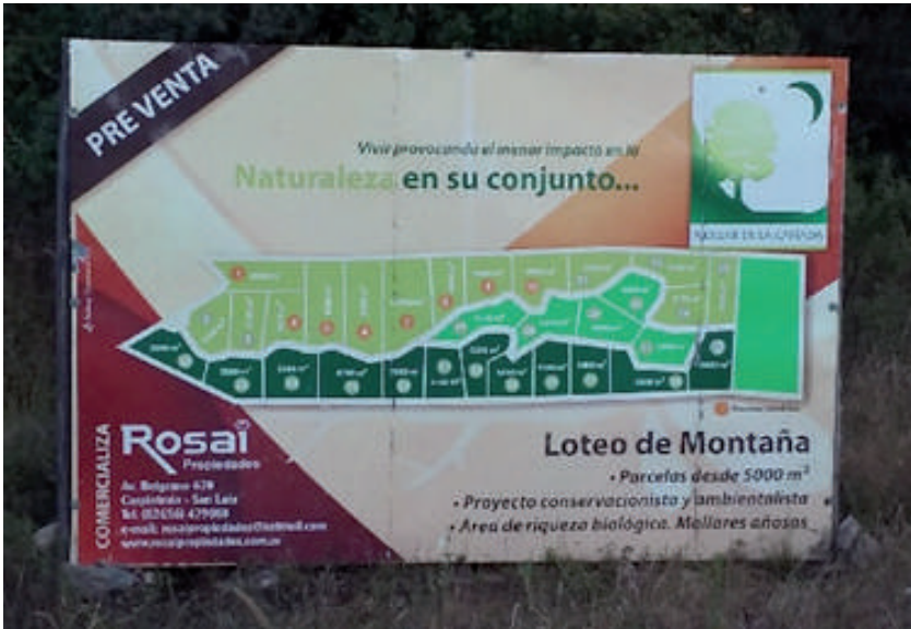
Figura 5. Promoción de loteos en base a protección de la naturaleza