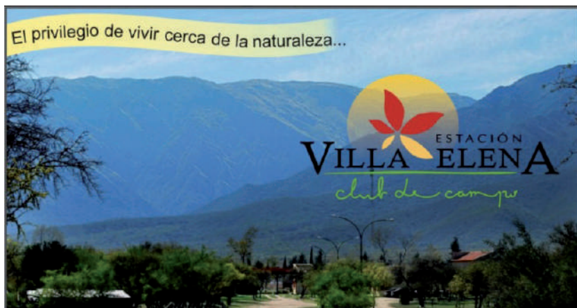
Figura 4. Imagen promocional del club de campo “Estación Villa Elena”

gen donde se intenta sostener y justificar una relación mercantilizada con la naturaleza, reproduciendo determinadas pautas de consumo comunes a este tipo de productos inmobiliarios a nivel nacional e internacional. El lenguaje utilizado para bautizar a los emprendimientos complementa y refuerza esta perspectiva, al combinar vagamente elementos de carácter local con otros comunes a productos inmobiliarios similares en el resto del país.