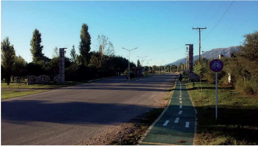
Figura 3. Boulevard “Paso de las Carretas” en Carpintería