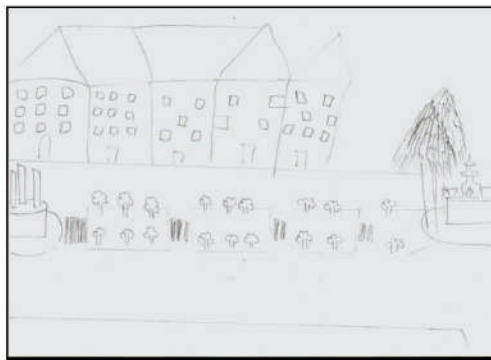
Figura N° 3. Representación urbana de la Avenida Arrabal de la ciudad de Requena, entre la Fuente de Colores y la Fuente de los Patos (izquierda). A la derecha, una fotografía en la que aparece una parte representada en el esquema mental

en común su ubicación céntrica en la trama urbana de la ciudad de Requena, por lo que suelen ser un punto de referencia para organizar el tiempo de ocio del alumnado. Muy próximo al castillo y dentro del casco histórico de la ciudad, otros estudiantes han representado dos elementos urbanos como son la misma Plaza del Albornoz 7 y la iglesia de El Salvador 8 . Por otra parte, la visión natural se circunscribe a la representación de los árboles plantados en la Avenida Arrabal y, en menor medida, los que se han desarrollado junto a la estación del ferrocarril de la ciudad de Requena. En ambos casos, estas especies arbóreas son aspectos lineales que separan los espacios peatonales de los espacios de tránsito de los vehículos y de los trenes, respectivamente. Otro caso de carácter puntual, ha sido la representación de las montañas pertenecientes a la sierra del Tejo, que se aprecian desde la parte más alta del barrio histórico de la Villa.