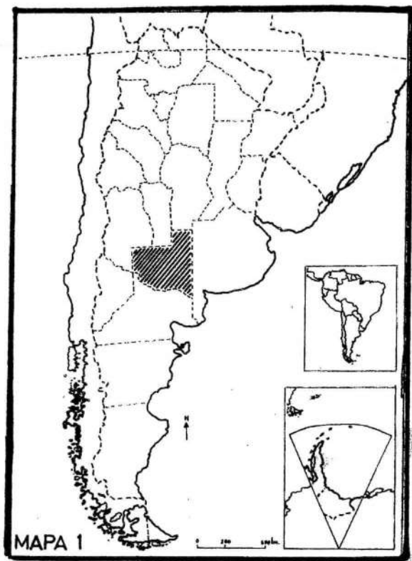
Mapa N° 1: La provincia de La Pampa en la República Argentina