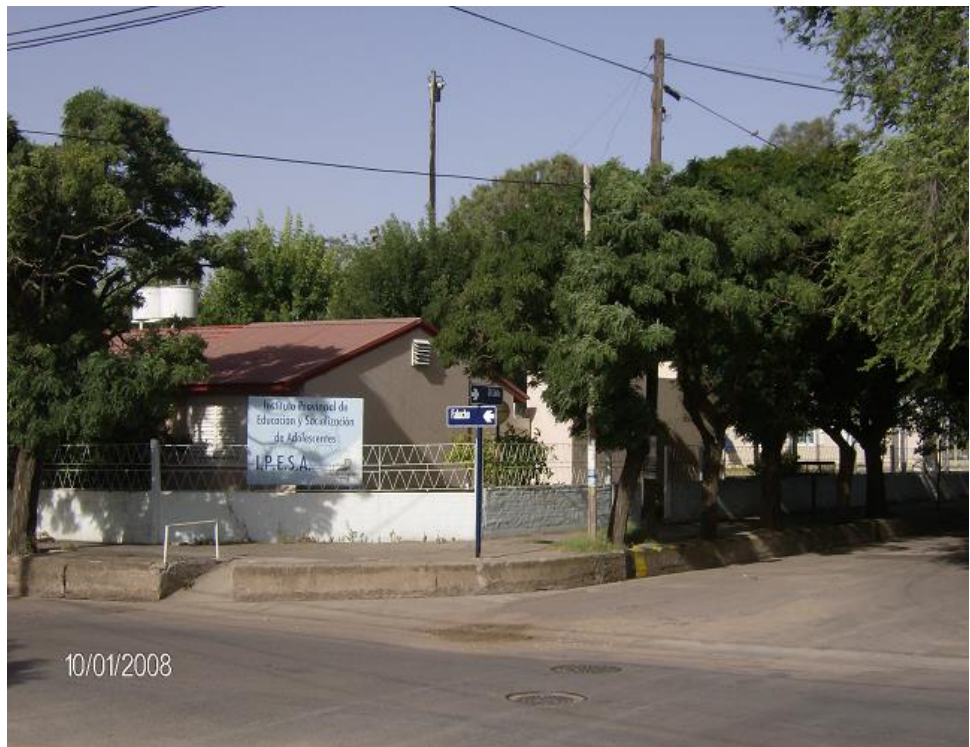
Edificio antiguo del IPESA.

Datos analizados que corresponden al período 2.004 a 2.007: